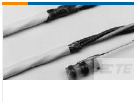
TE 产品编号C88166-000 S200-1-W1-22-9