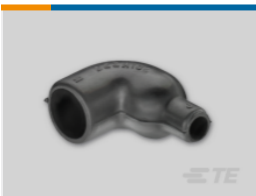
TE 产品编号806823-000 球形热缩护套：有嘴，直角