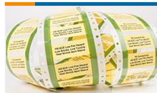
TE 产品编号F16068-000 HX-SCE-5K-3.2-50-S1-4