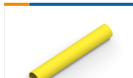
TE 产品编号4194036001 RNF-3000-R-6/2-4