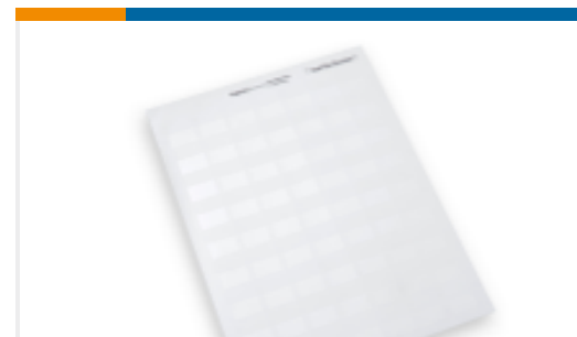
TE 产品编号8-1768016-8 CSL-05525P-4