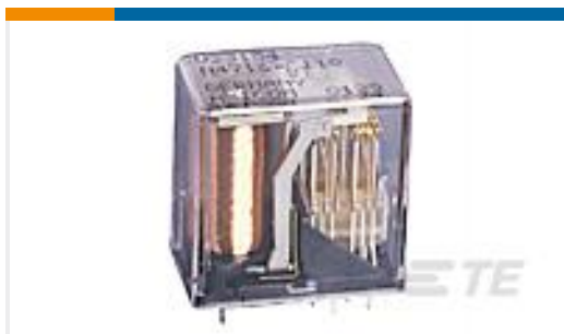
TE 产品编号9-1393806-4 V23154C 722B104