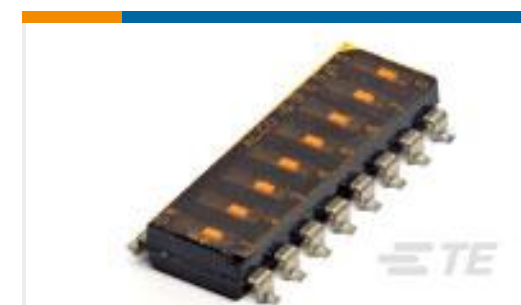
TE 产品编号1825006-1 GDS0204=DIP SW,SLIDE,THRU/HL