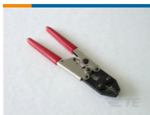
TE 产品编号 992008-000 AD-1377-CRIMP-TOOL-3-CVTY