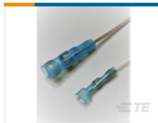
TE 产品编号 172711-000 D-183-0039