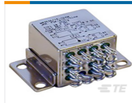
TE 产品编号 5-1617808-1 TD228-1803P=TDFO 10 SEC M83726/28-1803P