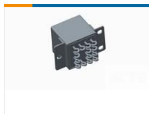
TE 产品编号 1617806-3 TD228-5000S=TDFO .5 SEC