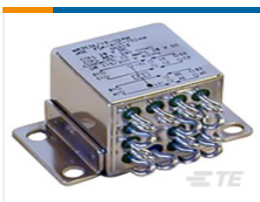
TE 产品编号 1617820-4 TD228-2403P 240SEC M83726/28-2403P