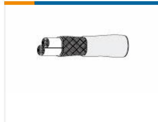
TE 产品编号 137317-000 55A1822-14-9/96-9CS2275