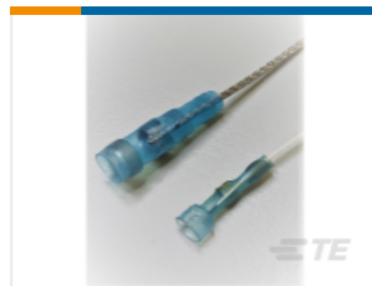
TE 产品编号 372141-000 D-183-0037