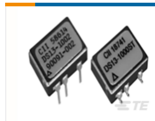
TE 产品编号 3-1617813-1 DS13-1001S = RELAY