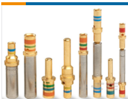
TE 产品编号ZPF000000000000545 020-0008-20