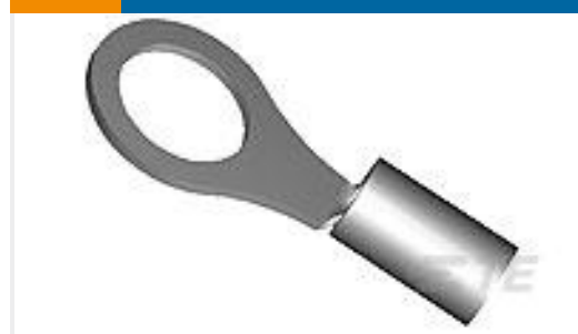
TE 产品编号322337 DIAMOND GRIP 16-14 HT R 8