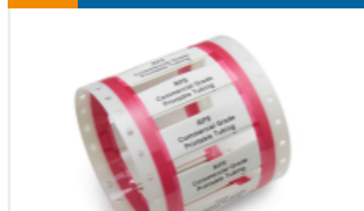
TE 产品编号2866050001 RPS-22-18/2.0-4