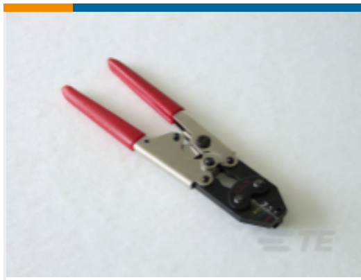
TE 产品编号 992008-000 AD-1377-CRIMP-TOOL-3-CVTY