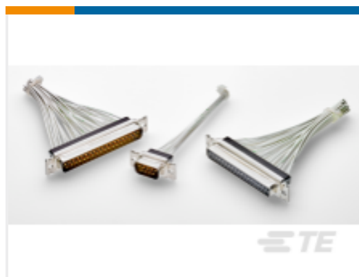
TE 产品编号2335889-5 AMPLIMITE SZ 5 PLUG. 50 POS, ST STL SHEL