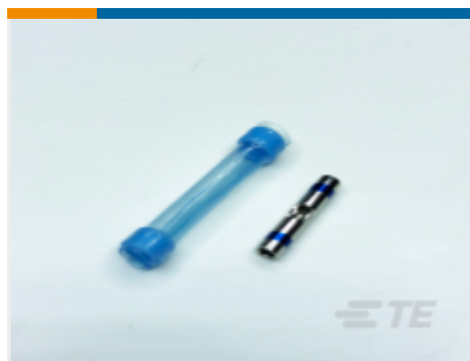
TE 产品编号C60253N001 D-200-84CS2901