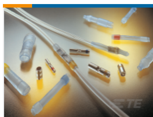
TE 产品编号6500740004 D-436-36CS391