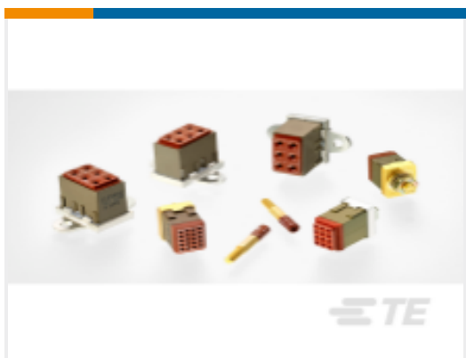
TE 产品编号CTJ720E01B-6144 MODULE ASSY