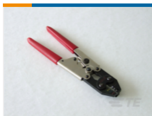
TE 产品编号 992008-000 AD-1377-CRIMP-TOOL-3-CVTY