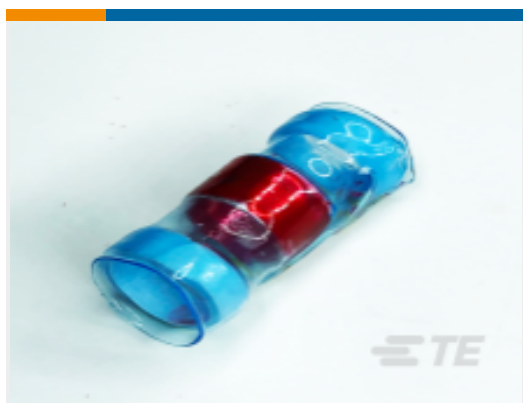
TE 产品编号CN5421-000 S200-5-00-TC