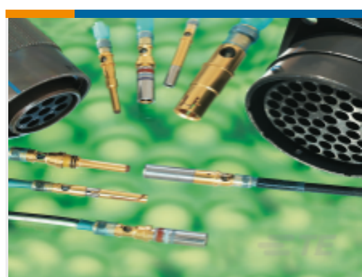
TE 产品编号D55601N001 D-602-0141-C11788CS1193