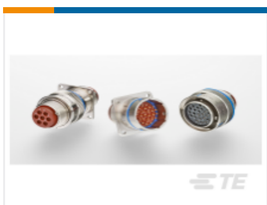
TE 产品编号YDL60R-20-16SNC012 RECP ASSY