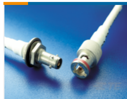
TE 产品编号613049-000 D-621-0436