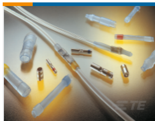
TE 产品编号970433-000 D-106-6025CS1241