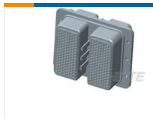
TE 产品编号445595-4 PLG KIT,ARINC 404,W/O CONTACTS