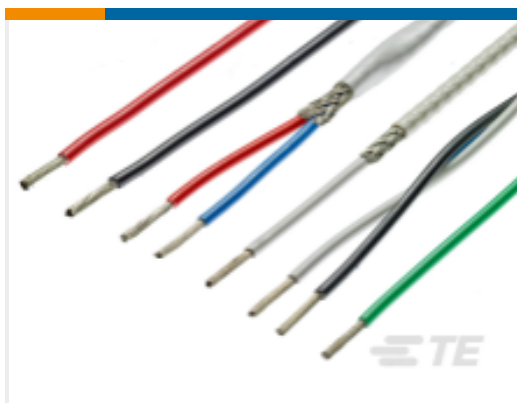
TE 产品编号670713-000 44A0141-16-MST4CS2275