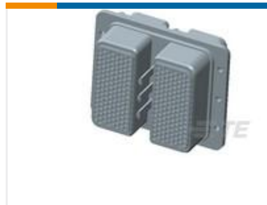
TE 产品编号445595-4 PLG KIT,ARINC 404,W/O CONTACTS