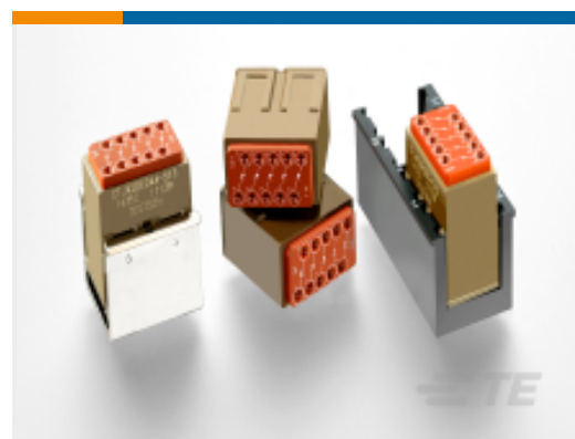
TE 产品编号CTJ420E337-513 ELEC MODULE