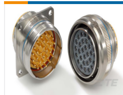
TE 产品编号ZPF00000000007732 983-0SE 24-61 SN-L