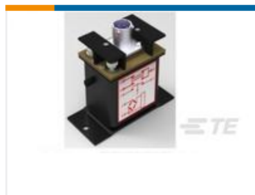
TE 产品编号1616095-3 NN233D=RELAY