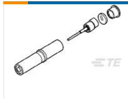
TE 产品编号448543-3 SOCKET,ARINC,SIZE 8,TRIAxIAL