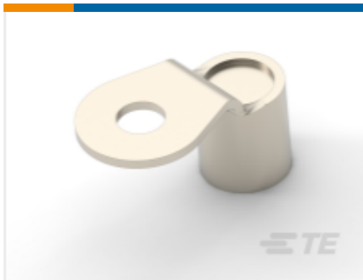
TE 产品编号1958542-1 TERM, STRAT, R, HR, 1/0, 5/16, 90 BEND