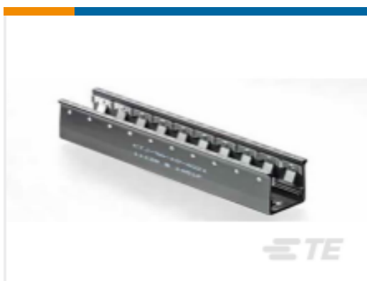
TE 产品编号CTJ-3B-02-4021 RAIL ASSY