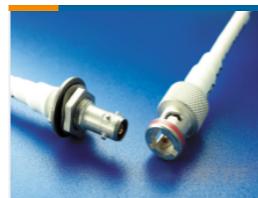
TE 产品编号613049-000 D-621-0436