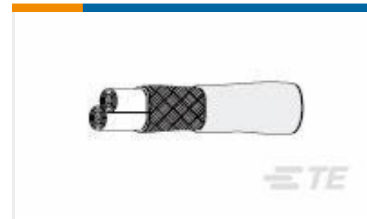
TE 产品编号 718759-000 44AM1121-22-9/96-9CS2275