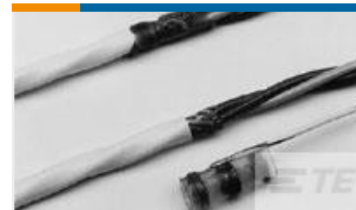
TE 产品编号 672223N002 S02-08-R-5CS816