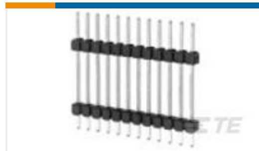
TE 产品编号 1-146458-9 19 MODII HDR SRST UNSHRD STKG