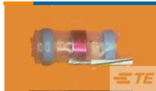
TE 产品编号 375094N002 S02-07-R-3CS816