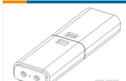
TE 产品编号65053-203 ELEC MODULE