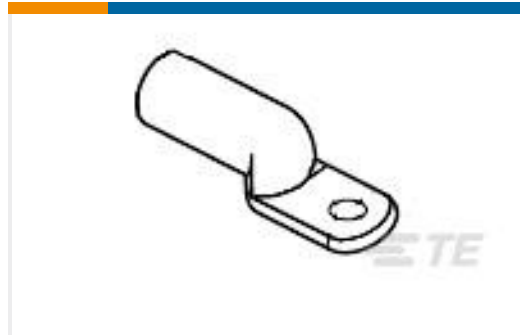
TE 产品编号277152-3 TERMINAL,COPALUM R 2/0 5/16