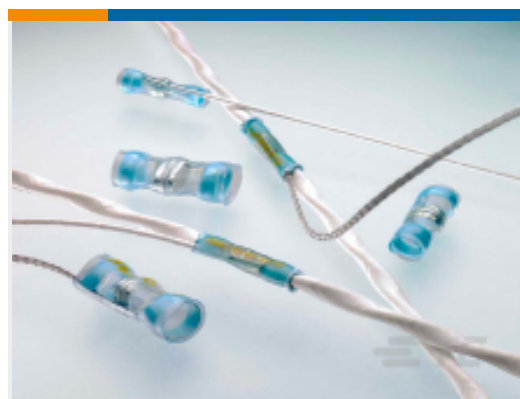
TE 产品编号CB0217-000 S200-5-W2-20-9