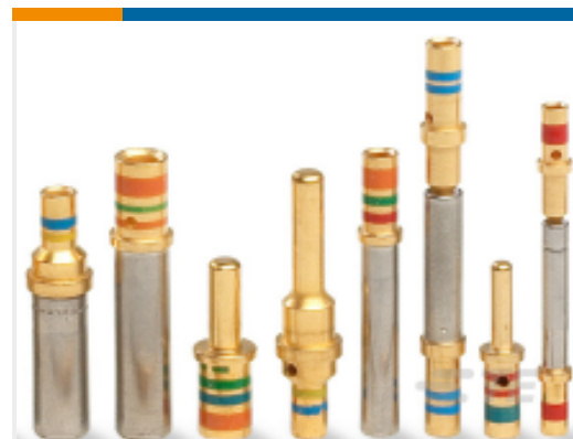
TE 产品编号ZPF000000000001198 097-0013-16 TRA