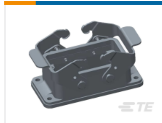
TE 产品编号T1410102000-000 H10B-AG