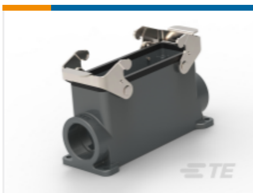
TE 产品编号T1470242132-000 H24B-SGRH-M32