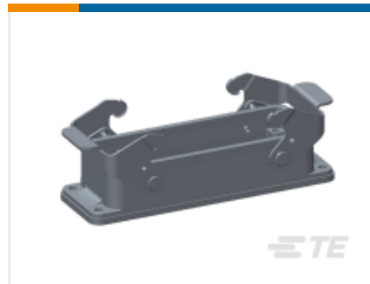
TE 产品编号T1410242000-000 H24B-AG