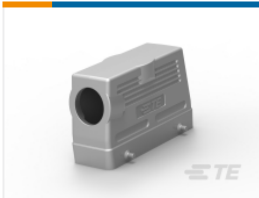
TE 产品编号T1230240132-000 H24B-TSH-M32