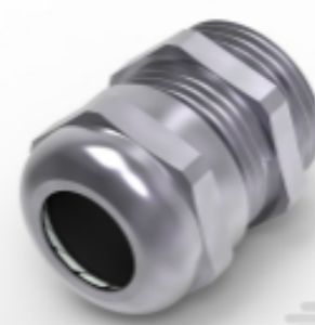
TE 产品编号 T3609320102-000 DLX-32-M