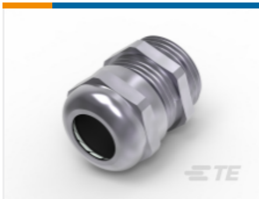
TE 产品编号T3609320102-000 DLX-32-M