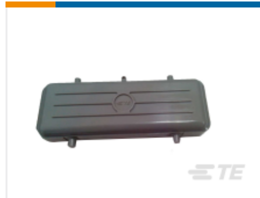
TE 产品编号T1010242100-000 H24B-KDBP