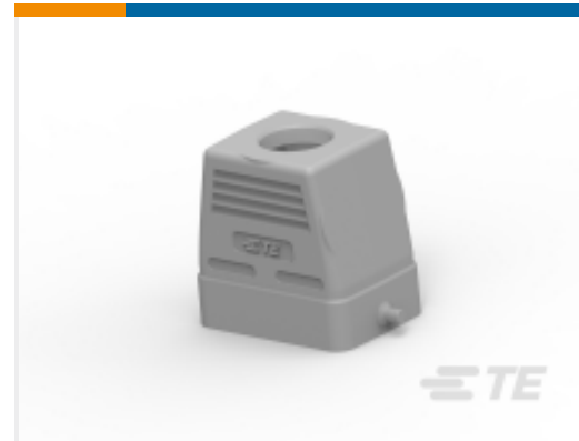
TE 产品编号T1320060125-000 H6B-TG-M25