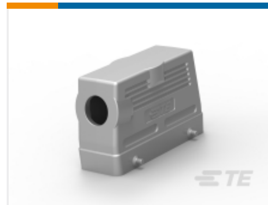
TE 产品编号T1230240125-000 H24B-TSH-M25