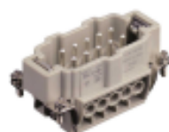
TE 产品编号 T2040102101-000 HE-010-M