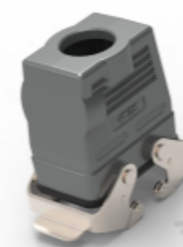
TE 产品编号 T1750101132-000 H10B-TBFHS-M32