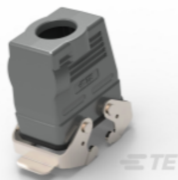
TE 产品编号 T1750102132-000 H10B-TBFH-M32