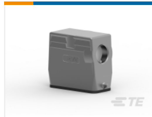
TE 产品编号T1319100120-000 H10A-TS-M20