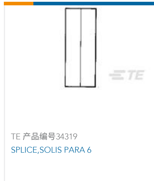
TE 产品编号34319 SPLICE,SOLIS PARA 6