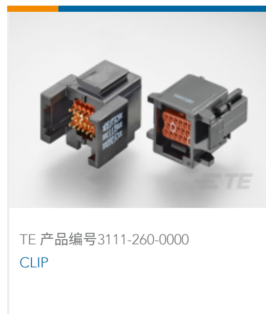
TE 产品编号3111-260-0000 CLIP