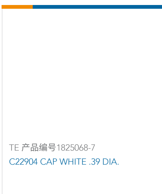
TE 产品编号1825068-7 C22904 CAP WHITE .39 DIA.