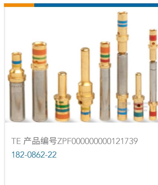
TE 产品编号ZPF000000000121739 182-0862-22