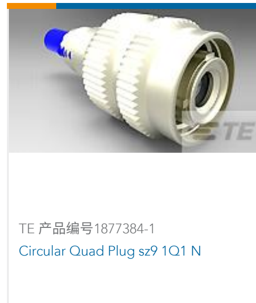
TE 产品编号1877384-1 Circular Quad Plug sz9 1Q1 N