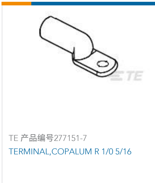
TE 产品编号277151-7 TERMINAL,COPALUM R 1/0 5/16