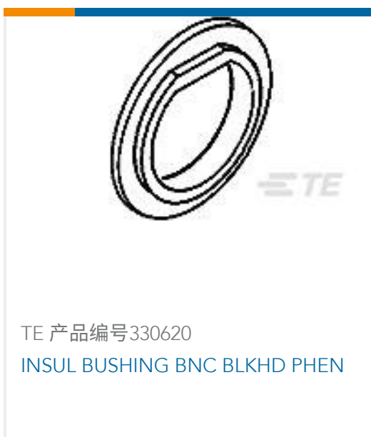
TE 产品编号330620 INSUL BUSHING BNC BLKHD PHEN