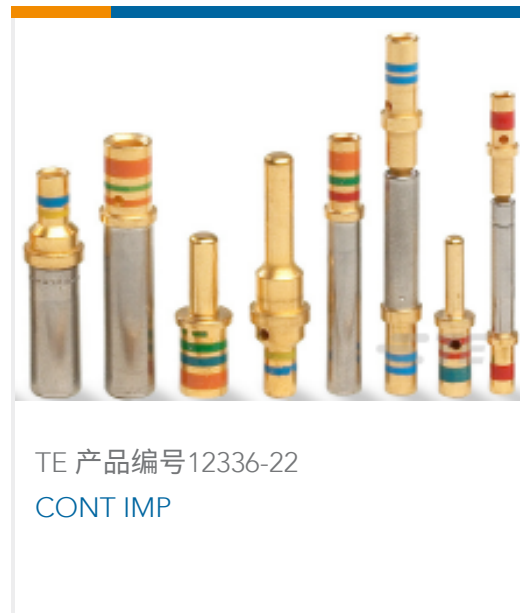
TE 产品编号12336-22 CONT IMP