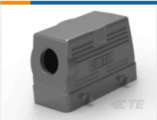
TE 产品编号T1210160125-000 H16B-TS-M25