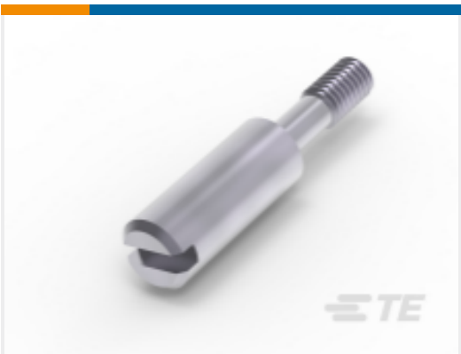
TE 产品编号T0931003003-000 CODING-PIN-M3