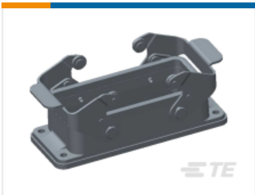
TE 产品编号T1410161000-000 H16B-AGS