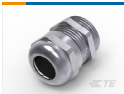
TE 产品编号 T3609200102-000 DLX-20-M