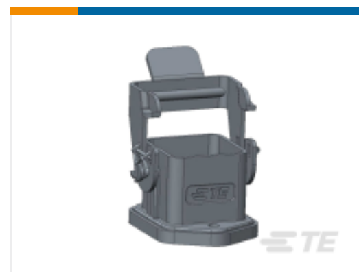
TE 产品编号 T1509030000-000 H3A-MAG