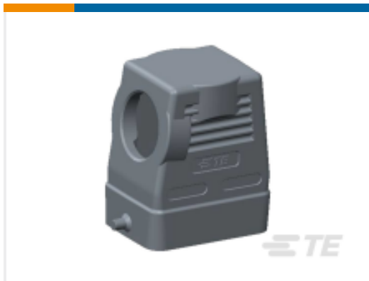
TE 产品编号T1330060132-000 H6B-TSH-M32