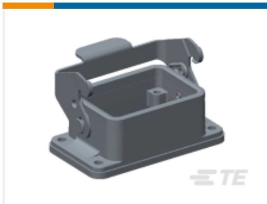
TE 产品编号T1500063000-000 H6B-AG