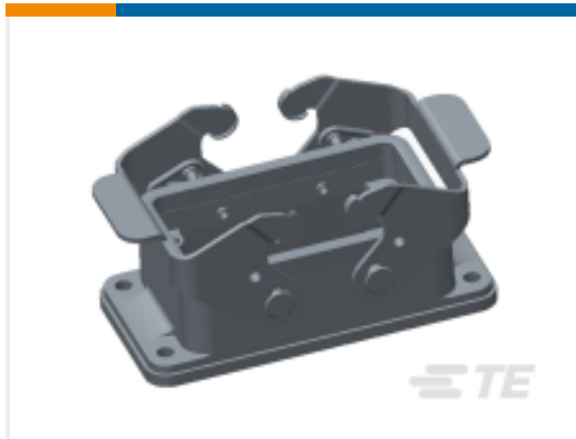
TE 产品编号T1410102000-000 H10B-AG