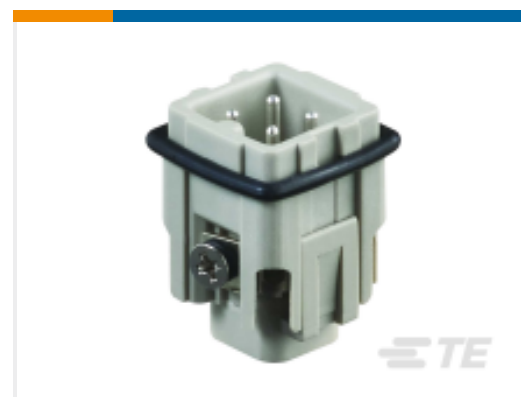
TE 产品编号 T2010032101-000 HA-003-M