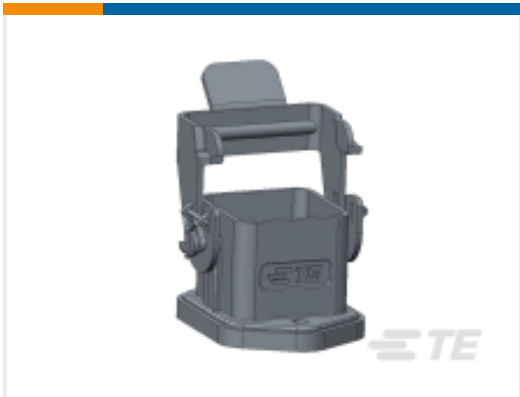
TE 产品编号T1509030000-000 H3A-MAG