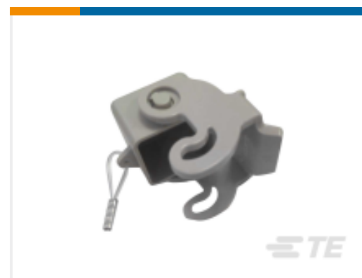
TE 产品编号 T1010031100-000 H3A-KDTP