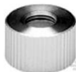
TE 产品编号 8-1437627-5 G12KB=BUTTON GUARD KNURL BLACK