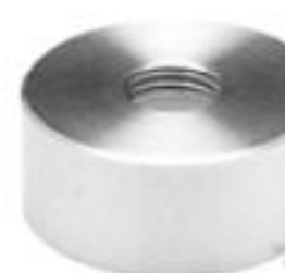
TE 产品编号 8-1437627-7 G13A=BUTTON GUARD ALUM