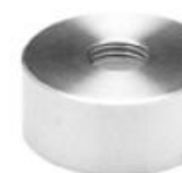
TE 产品编号 8-1437627-9 G13C=BUTTON GUARD CHROME