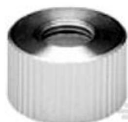
TE 产品编号 8-1437627-6 G12KC=BUTTON GUARD KNURL CHROM