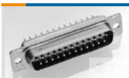
TE 产品编号205161-1 AMPLIMITE,ASY,RCPT,STD,109,1