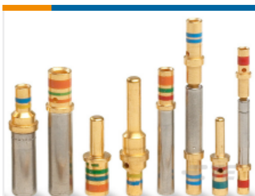
TE 产品编号1662-213-2031 CONT SOC ASSY