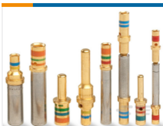
TE 产品编号 0007-008-100L CONT SOC ASSY