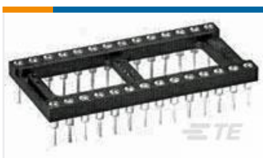
TE 产品编号1-1437539-4 814-AG10D-ES=SOCKET ASSY