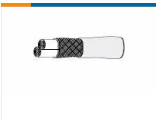
TE 产品编号169311-000 55A1822-24-9/96-9CS2275