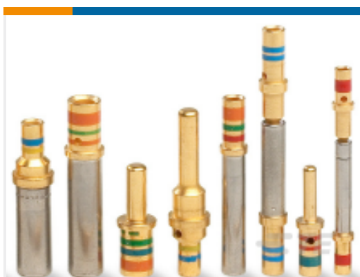
TE 产品编号1841-1-5620 CONT PIN