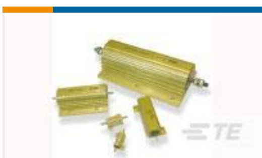
TE 产品编号1676814-5 HSA5 330R 1%