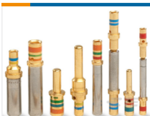
TE 产品编号0641-1-2031L CONT PIN