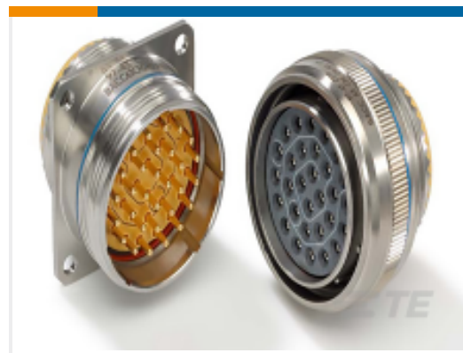
TE 产品编号ZPF000000000008157 983-6K 20-41 S8 L