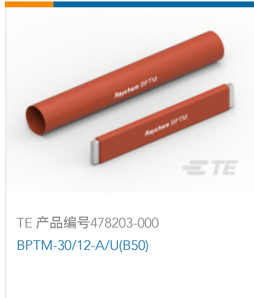
TE 产品编号478203-000 BPTM-30/12-A/U(B50)