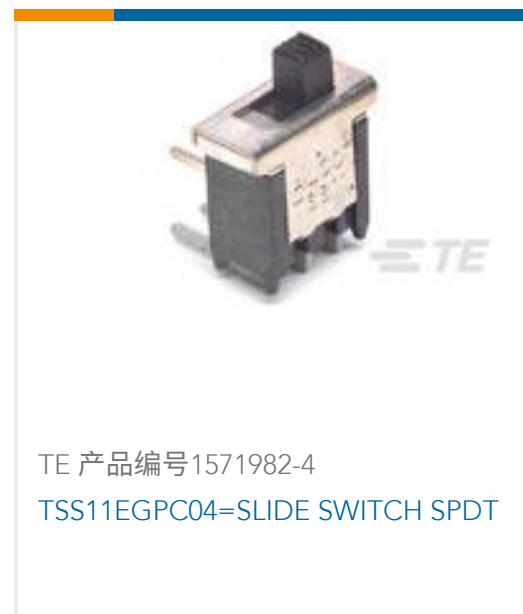
TE 产品编号1571982-4 TSS11EGPC04=SLIDE SWITCH SPDT