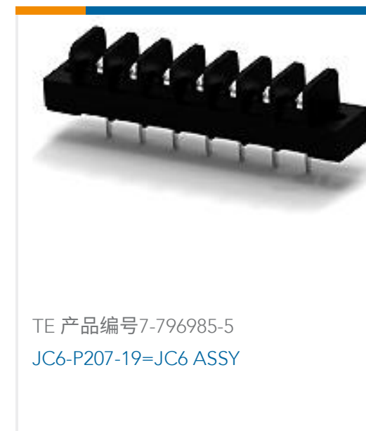
TE 产品编号7-796985-5 JC6-P207-19=JC6 ASSY