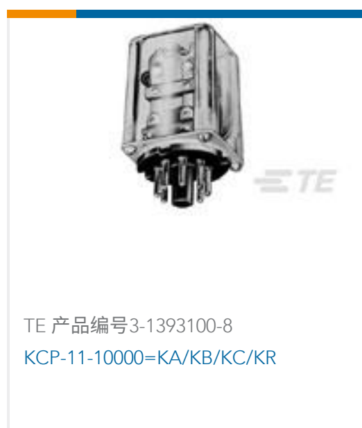
TE 产品编号3-1393100-8 KCP-11-10000=KA/KB/KC/KR