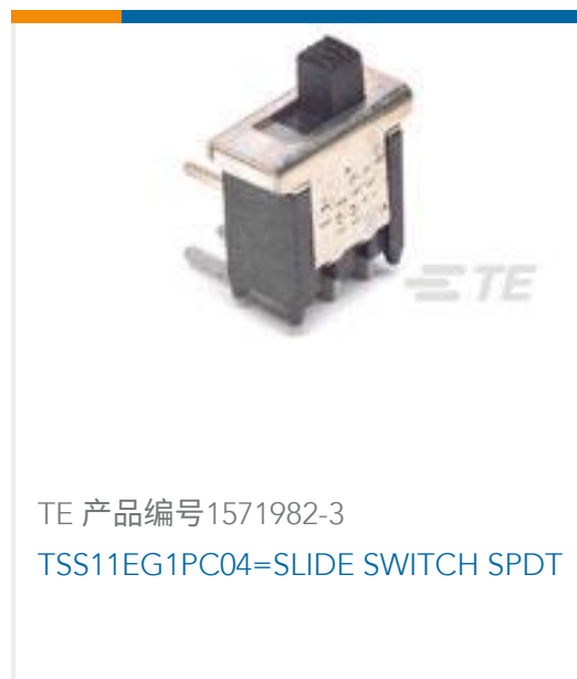
TE 产品编号1571982-3 TSS11EG1PC04=SLIDE SWITCH SPDT