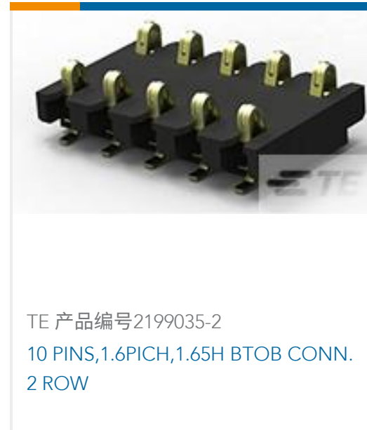
TE 产品编号2199035-2 10 PINS,1.6PICH,1.65H BTOB CONN. 2 ROW