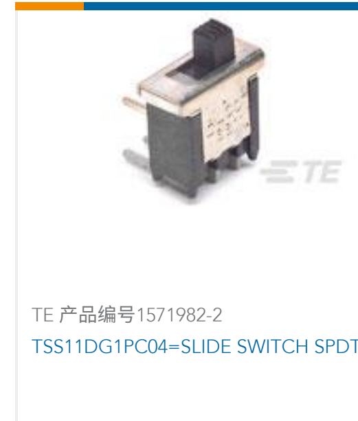
TE 产品编号1571982-2 TSS11DG1PC04=SLIDE SWITCH SPDT