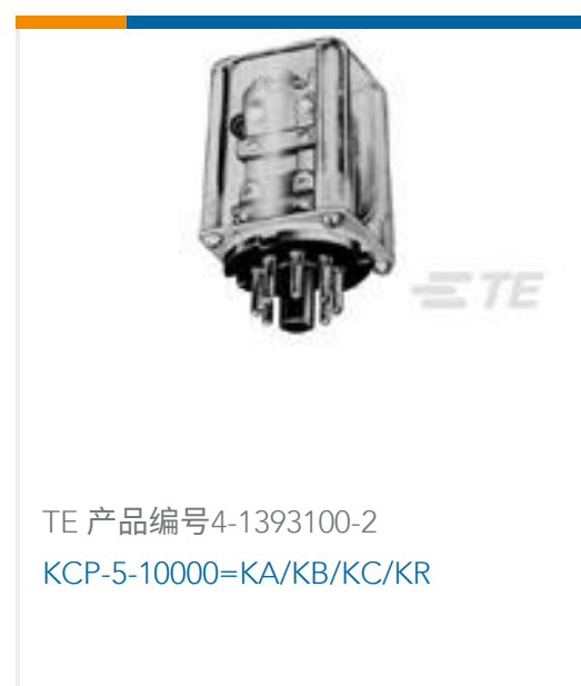
TE 产品编号4-1393100-2 KCP-5-10000=KA/KB/KC/KR