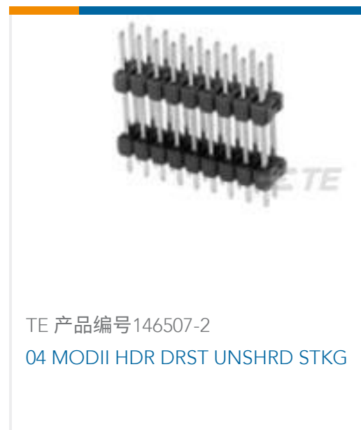
TE 产品编号146507-2 04 MODII HDR DRST UNSHRD STKG