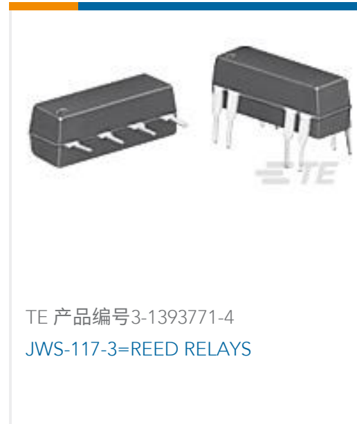
TE 产品编号3-1393771-4 JWS-117-3=REED RELAYS