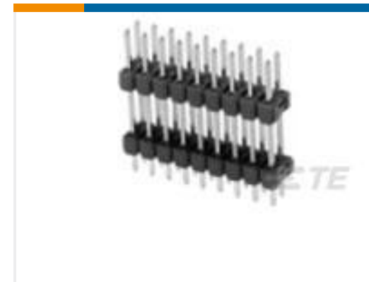
TE 产品编号146507-2 04 MODII HDR DRST UNSHRD STKG