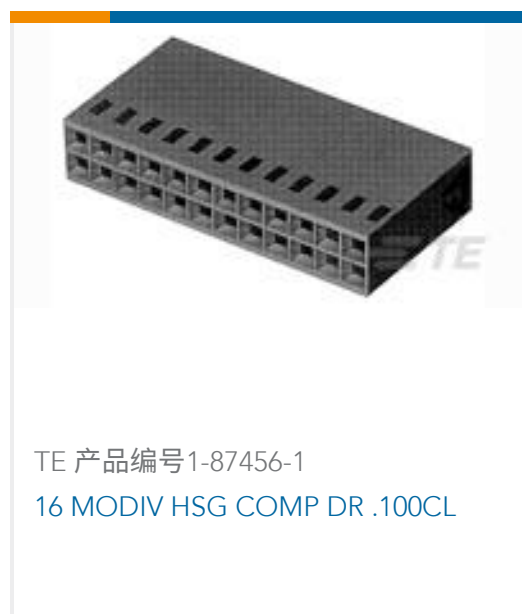
TE 产品编号1-87456-1 16 MODIV HSG COMP DR .100CL