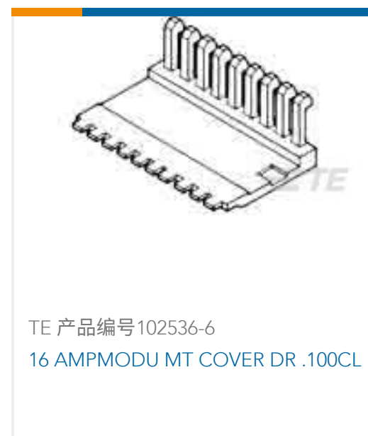
TE 产品编号102536-6 16 AMPMODU MT COVER DR .100CL