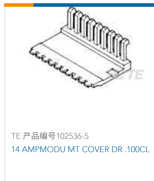
TE 产品编号102536-5 14 AMPMODU MT COVER DR .100CL