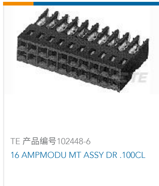
TE 产品编号102448-6 16 AMPMODU MT ASSY DR .100CL