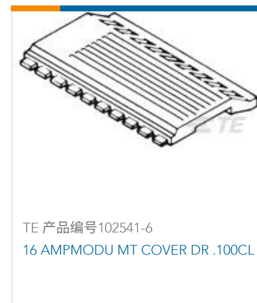
TE 产品编号102541-6 16 AMPMODU MT COVER DR .100CL