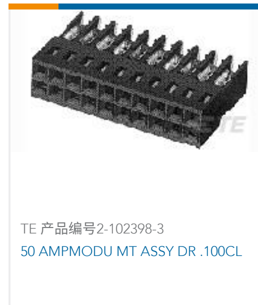
TE 产品编号2-102398-3 50 AMPMODU MT ASSY DR .100CL