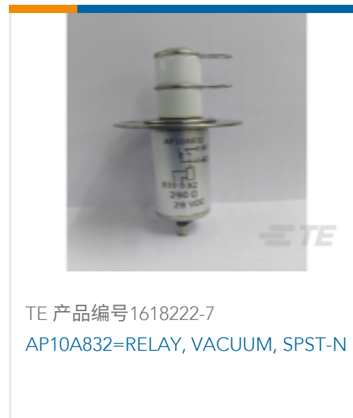
TE 产品编号1618222-7 AP10A832=RELAY, VACUUM, SPST-N