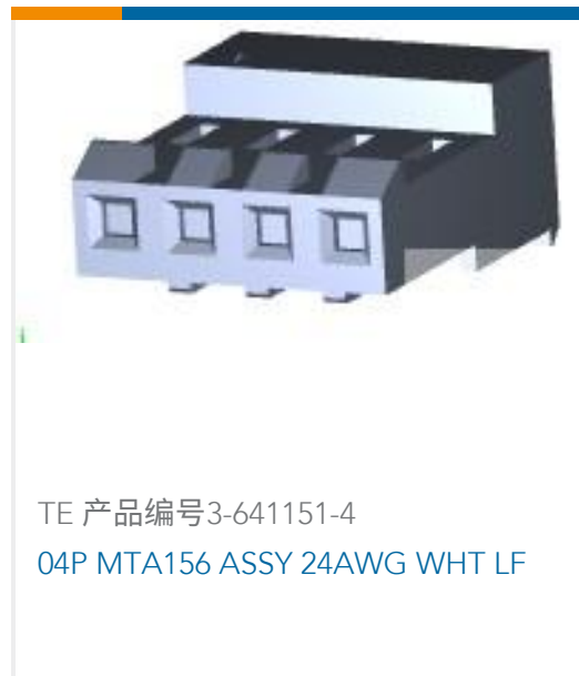
TE 产品编号3-641151-4 04P MTA156 ASSY 24AWG WHT LF