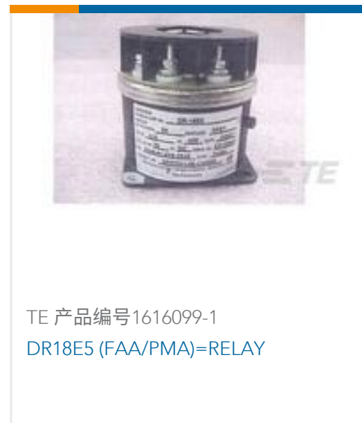
TE 产品编号1616099-1 DR18E5 (FAA/PMA)=RELAY