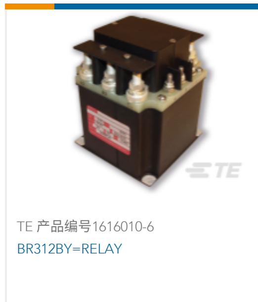
TE 产品编号1616010-6 BR312BY=RELAY