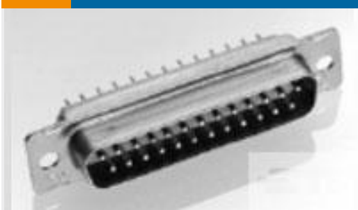
TE 产品编号 205564-2 AMPLIMITE,ASY,PLUG,STD,109,5