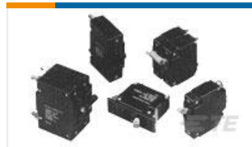
TE 产品编号 1393255-8 W93-X112-30=M6/M7/M9/W6/W7