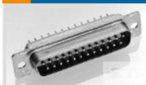
TE 产品编号 205555-2 AMPLIMITE,ASY,RCPT,STD,109,1