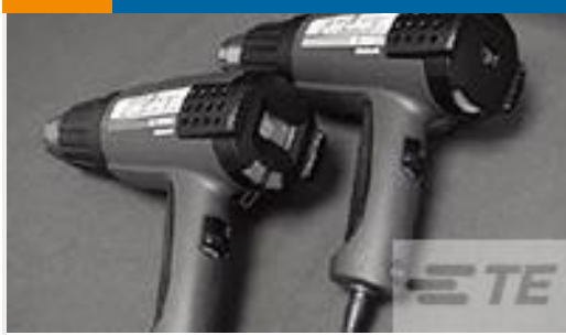
TE 产品编号 CJ2087-000 HL2010E-KIT-120V