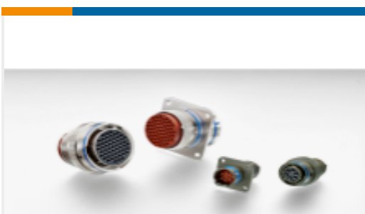
TE 产品编号 YAFD56-22-55PNC012 PLUG ASSY