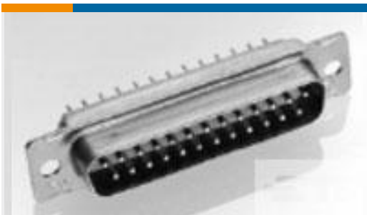
TE 产品编号 1757824-9 AMPLIMITE,ASY,RCPT,STD,90,ZN,3,CT