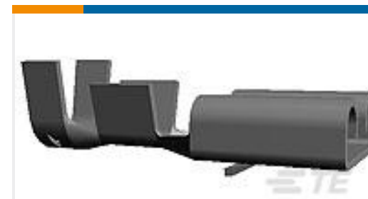
TE 产品编号 160811-5 FF 250 REC 4-6MM2 BR SILVER PLATED