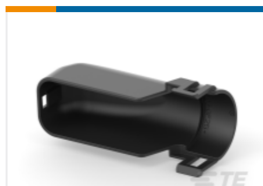
TE 产品编号 2112046-2 COVER, 90, FOR 26 POS