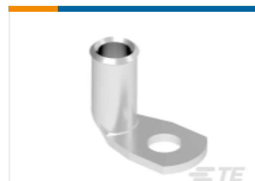
TE 产品编号 708471-1 XCT 10-6 EQ