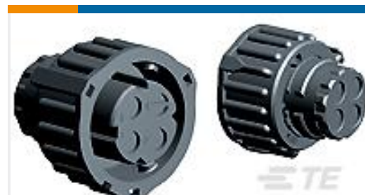
TE 产品编号 3-1719434-2 4 POS DIA 2.5 SOCKET CONNECTOR HSG