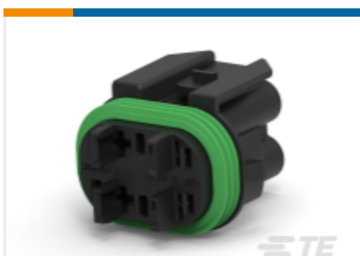
TE 产品编号 2066046-3 2 POS MINI FUSE BOX ASSY