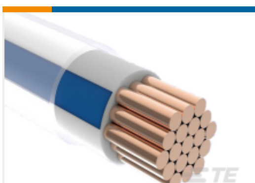
TE 产品编号 7180803001 ACW0219-2.50-61(NS)