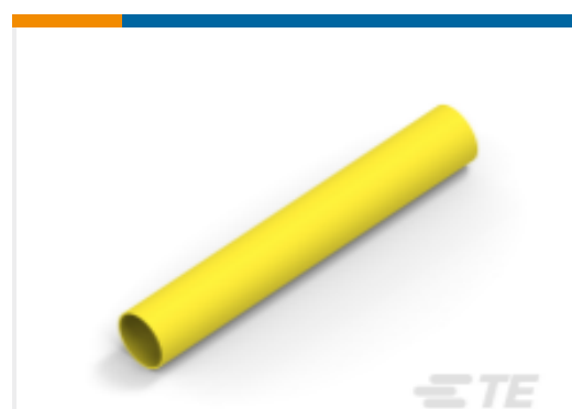
TE 产品编号 NB14852001 DWP-125-1/2-4-STK