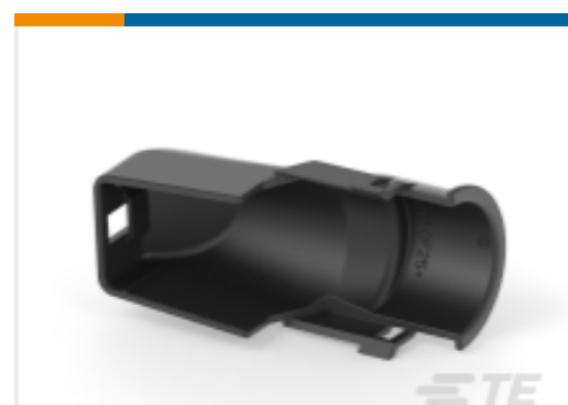
TE 产品编号 2112452-2 COVER, FOR 22 POS