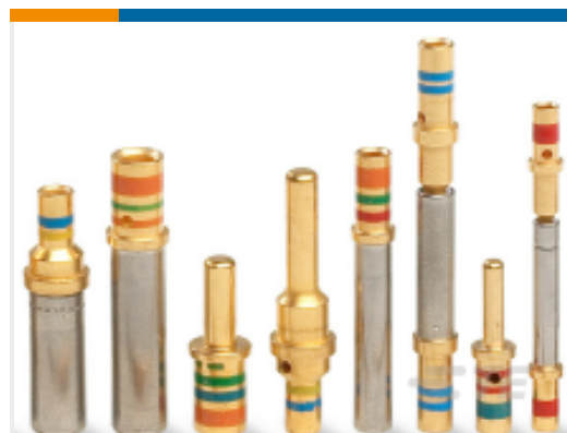
TE 产品编号12333-22 CONT T.22 FEMELLE 1500 (SEE 182-0447-22)