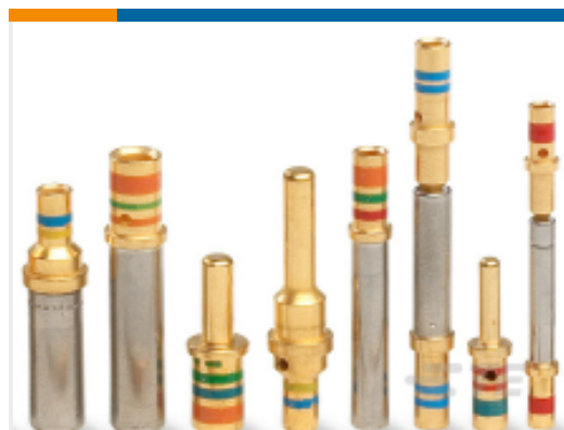
TE 产品编号12331-22 CONT PIN (182-0441-22)