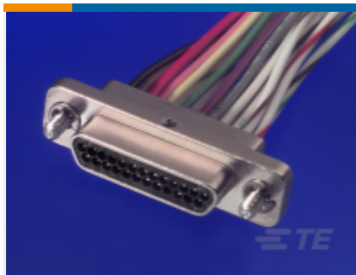
TE 产品编号2-1532172-7 M83513/04-B11C, MCKS-C2-B-15S6Q9-18.0