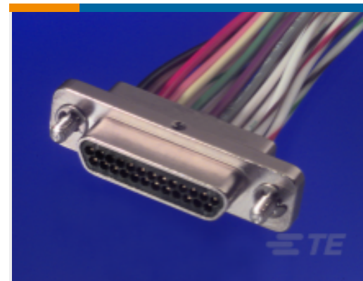
TE 产品编号2-1532184-8 M83513/03-F12C, MCKS-C2-B-37P6Q9-36.0