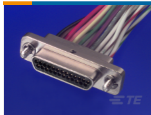
TE 产品编号2-1532176-7 M83513/04-F11C, MCKS-C2-B-37S6Q9-18.0