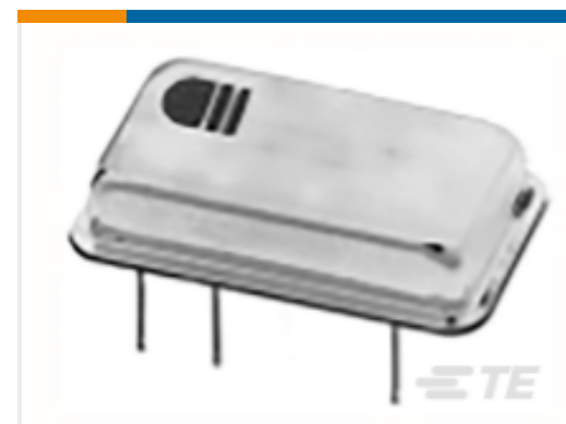
TE 产品编号3-1618400-8 DS11-1005T=SOLID STATE RELAY