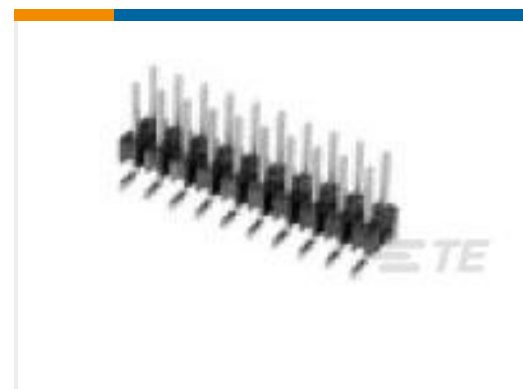
TE 产品编号147279-1 06 MODII HDR DR SFMT B/A T&R