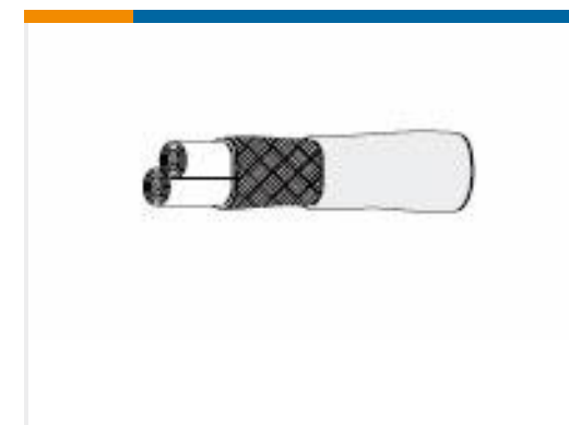
TE 产品编号159795-000 55A1142-16-MST4-9CS2275