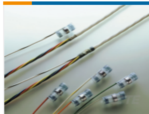
TE 产品编号733509N001 S02-17-R-5CS928