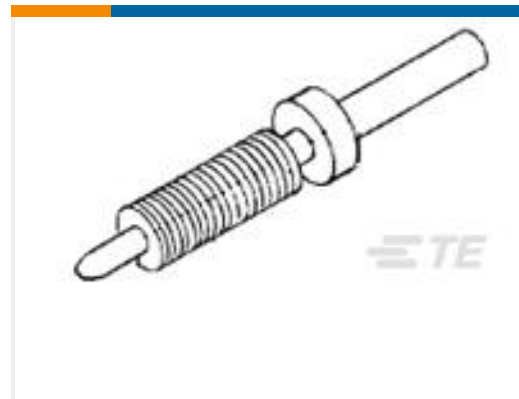
TE 产品编号530754-1 BOX JACKSCREW ASSY-MALE