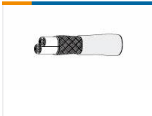
TE 产品编号159795-000 55A1142-16-MST4-9CS2275