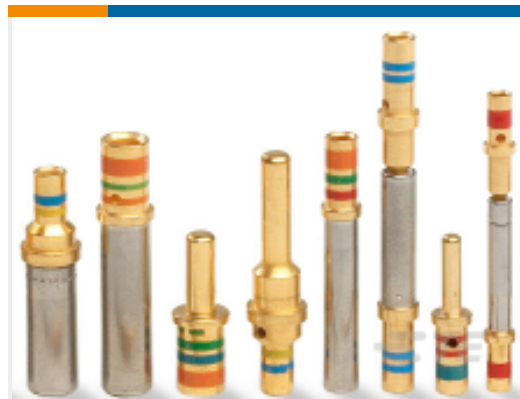
TE 产品编号6162-347-1231 CONT SOC ASSY