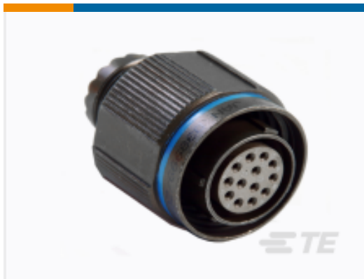
TE 产品编号YDTS26W25-20ANV001 PLUG ASSY