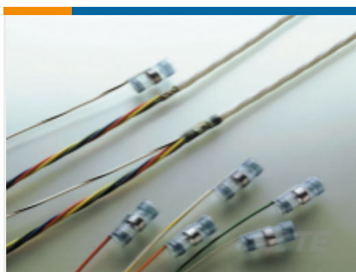
TE 产品编号801635N001 S02-18-R-9CS1092