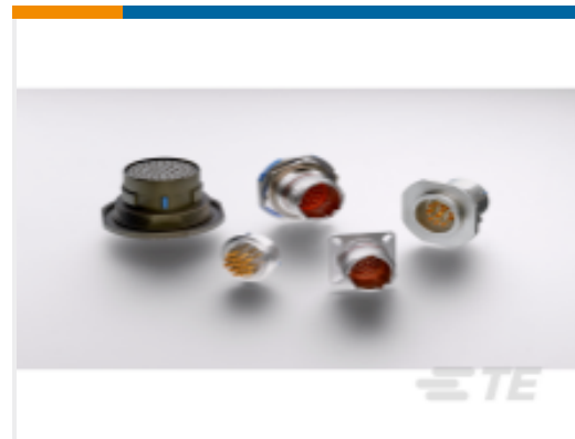
TE 产品编号YDTS24N15-97CNV001 HERM RECP