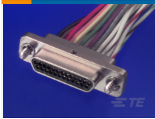
TE 产品编号2-1532176-7 M83513/04-F11C, MCKS-C2-B-37S6Q9-18.0