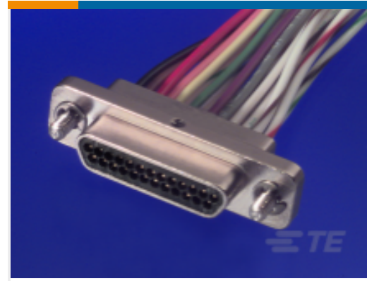
TE 产品编号2-1532184-8 M83513/03-F12C, MCKS-C2-B-37P6Q9-36.0