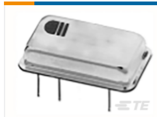
TE 产品编号3-1618400-8 DS11-1005T=SOLID STATE RELAY