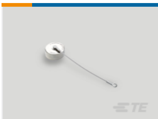
TE 产品编号YDTS33T15RV0010000 CAP ASSEMBLY