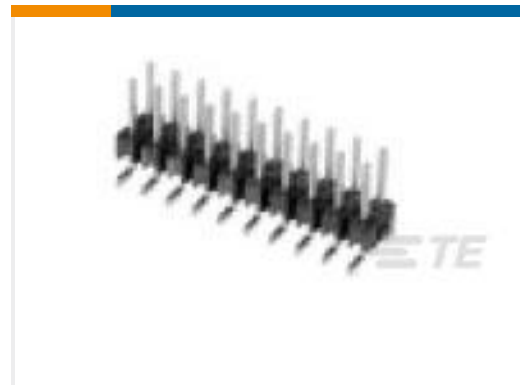
TE 产品编号147279-1 06 MODII HDR DR SFMT B/A T&R