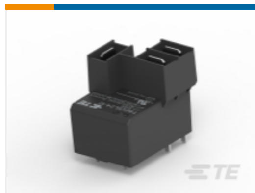
TE 产品编号1558671-8 T9GV1L24-48