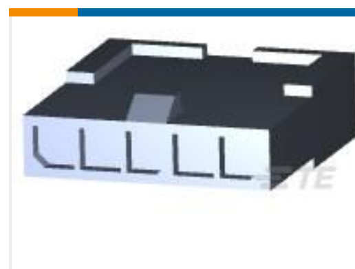
TE 产品编号1445049-5 FREE HANG SNGL ROW HSG 5 POS