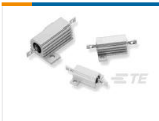
TE 产品编号2-1879075-3 THS25 8R2 5%