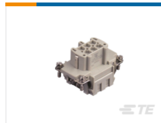
TE 产品编号T2040063201-000 HE-006-FS