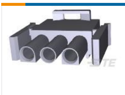
TE 产品编号1-480700-2 03P UMNL PLUG HSG RED