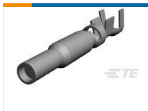
TE 产品编号1-770008-0 UMNLI SOK SN/AU/PHBZ LF