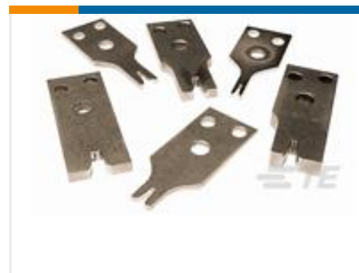
TE 产品编号1-456401-6 CRIMPER, WIRE .042 "F"