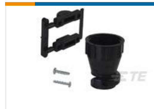
TE 产品编号 206070-8 CABLE CLAMP KIT #17