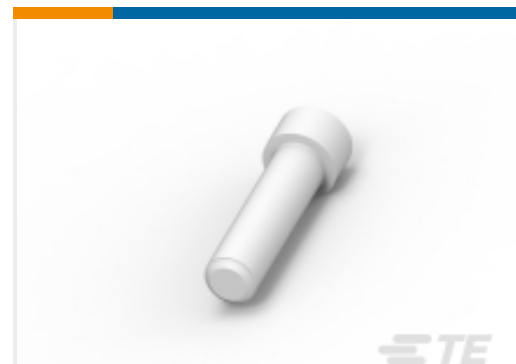
TE 产品编号 114017-ZZ SEALING PLUG, SIZE 12/16, WHT