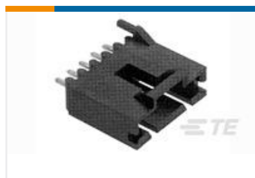
TE 产品编号 104450-4 05 MTE HDR SRST LATCH W/HLDWN