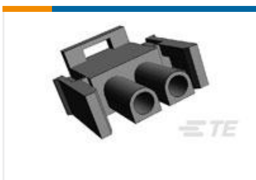
TE 产品编号 1-480698-0 02P UMNL PLUG HSG NATL