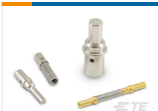
TE 产品编号 0462-201-20141 DEUTSCH 实芯端子