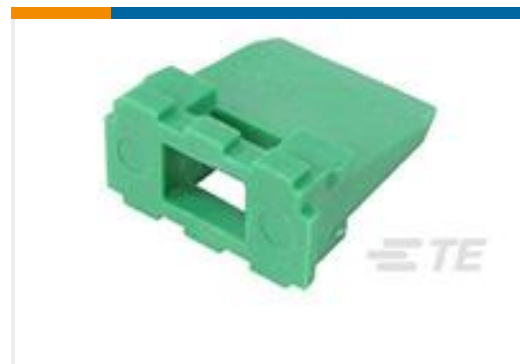
TE 产品编号 W6P WEDGE LOCK, 6P, REC, GRN, DT