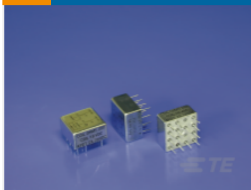
TE 产品编号 1-1617076-5 3SBH1148A2 = M39016/14-006M