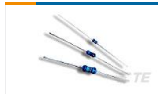
TE 产品编号1622730-1 LR2 1% 30K