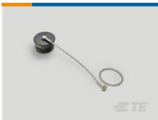
TE 产品编号YDTS32F25NV0010000 DUST COVER ASSEM