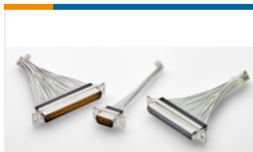
TE 产品编号2335889-1 AMPLIMITE SZ 1 PLUG. 9 POS, ST STL SHELL