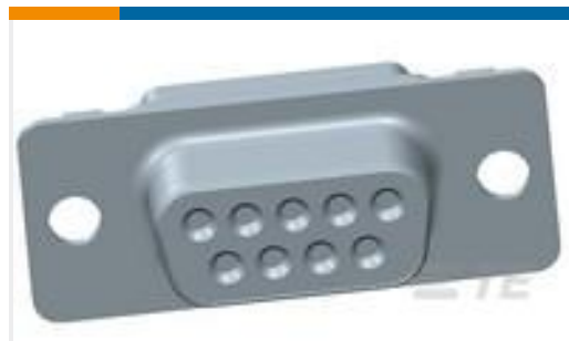
TE 产品编号205161-5 AMPLIMITE,ASY,RCPT,109,1