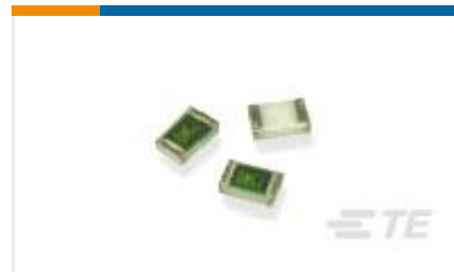
TE 产品编号3-2176090-1 RP 1J 0.166W 267K 0.1% 25PPM 1K RL