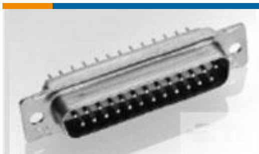
TE 产品编号205164-6 AMPLIMITE,ASY,PLUG,109,2