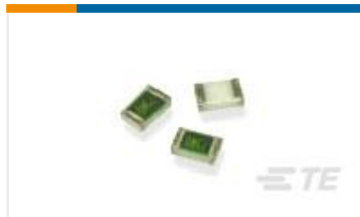
TE 产品编号3-2176090-1 RP 1J 0.166W 267K 0.1% 25PPM 1K RL