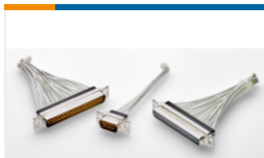
TE 产品编号2335889-1 AMPLIMITE SZ 1 PLUG. 9 POS, ST STL SHELL