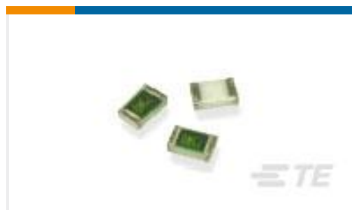
TE 产品编号3-2176090-1 RP 1J 0.166W 267K 0.1% 25PPM 1K RL