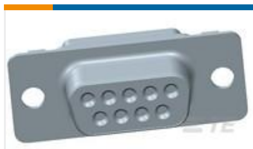
TE 产品编号205161-5 AMPLIMITE,ASY,RCPT,109,1