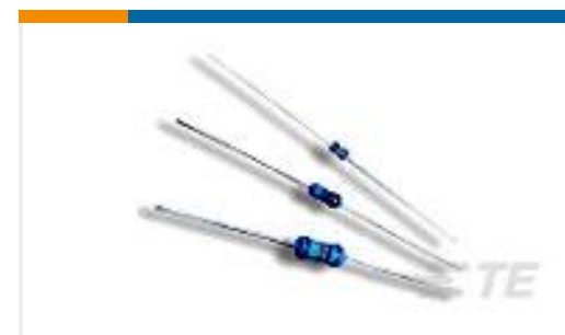
TE 产品编号1622730-1 LR2 1% 30K