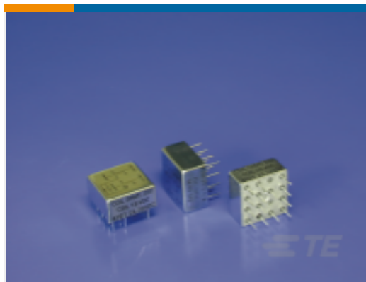
TE 产品编号 1-1617076-5 3SBH1148A2 = M39016/14-006M