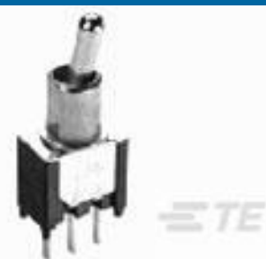
TE 产品编号 9-1437562-8 TTE13E8T1/4=SW TOGGLE WATERTIG