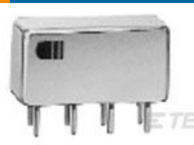
TE 产品编号 1617024-6 HF1201A00 = HF 1/2 SIZE RELAY