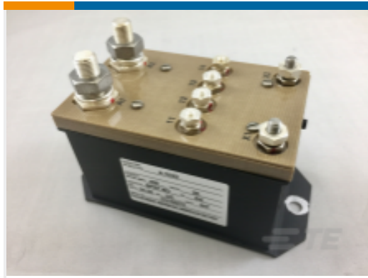
TE 产品编号 1616058-9 A703DB=RELAY