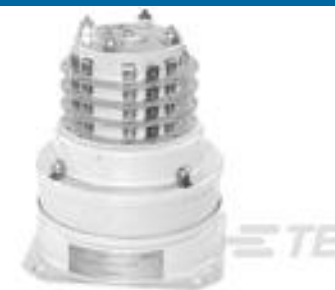
TE 产品编号 1-1393139-9 MDR-170-2=MDR