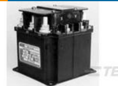
TE 产品编号 1616004-5 B312CV=RELAY