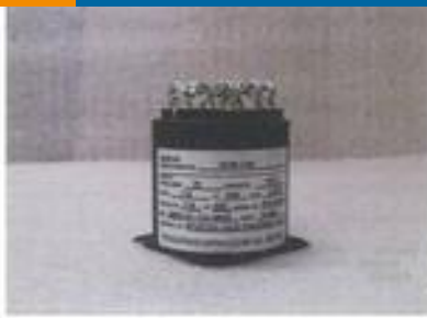
TE 产品编号 1-1616037-2 DHR14B=RELAY