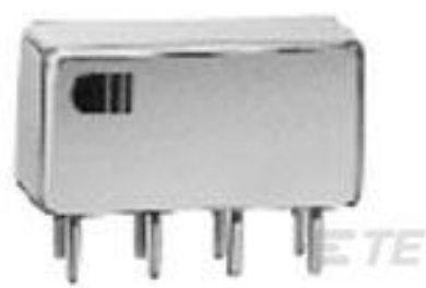
TE 产品编号 3-1617028-1 HFW1105D00 = HFW 1/2 SIZE RELA