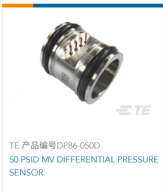
TE 产品编号DP86-050D 50 PSID MV DIFFERENTIAL PRESSURE SENSOR