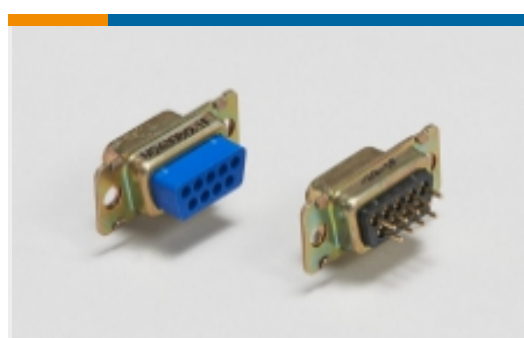
盒内安装 D-Sub 连接器(20)