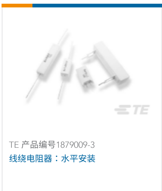
TE 产品编号1879009-3 线绕电阻器：水平安装