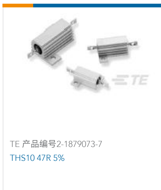
TE 产品编号2-1879073-7 THS10 47R 5%