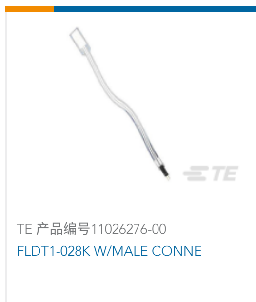
TE 产品编号11026276-00 FLDT1-028K W/MALE CONNE