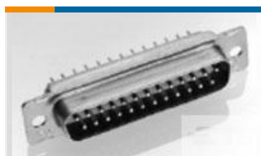
TE 产品编号1757819-4 AMPLIMITE,ASY,PLUG,STD,109,ZN,4