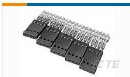
TE 产品编号104439-2 5X3 MTE RCPT SR PLAIN .100CL