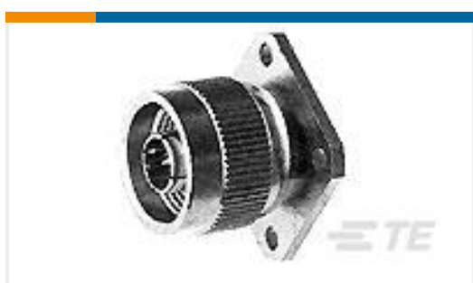
TE 产品编号1057277-1 3051 1200 10