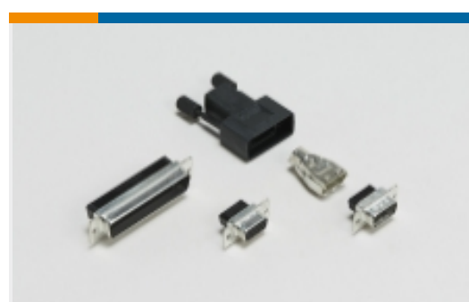
压接 D-Sub 连接器(2)