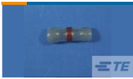
TE 产品编号359539-000 D-108-10CS948