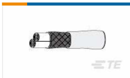
TE 产品编号306040-001 44AM1121-20-0/2-9