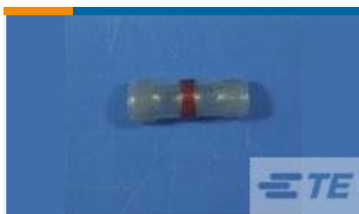
TE 产品编号359539-000 D-108-10CS948