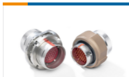
TE 产品编号ZPF00000000099828 901-21 RT 2-37-0 SN