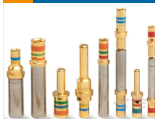
TE 产品编号2560-215-1631L CONT PIN