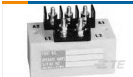
TE 产品编号1616502 Q50AB1 (FAA/PMA)=RELAY