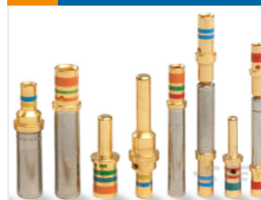
TE 产品编号2560-218-2031 CONT PIN