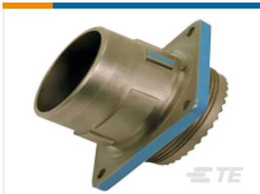
TE 产品编号YDIV46E17-06SNC128 PLUG ASSY