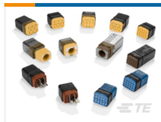
TE 产品编号ZPF000000000163975 DMC-M 99-04 CN (=33537-PC000)