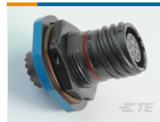
TE 产品编号YACT24MA98SNV00100 JAM NUT RECEPTACLE