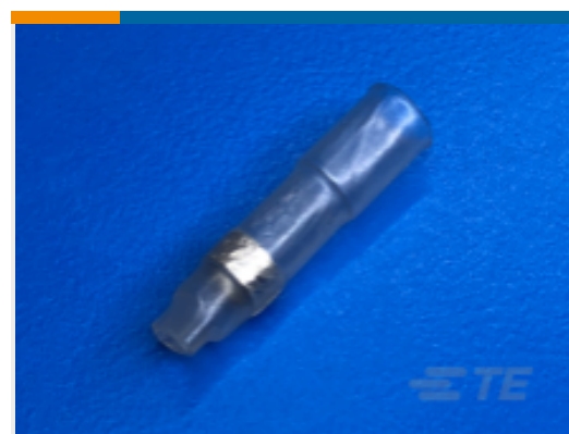
TE 产品编号F78598-000 B-155-1504