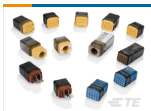
TE 产品编号ZPF00000000015222 DMC-M 08-16 BB