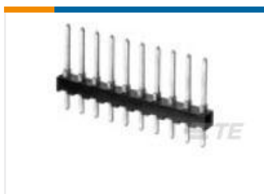
TE 产品编号1-87465-7 16 MODII HDR SRST UNSHRD .100