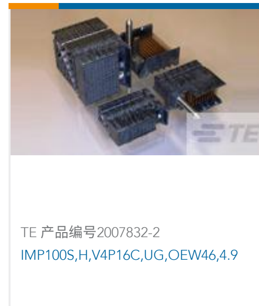
TE 产品编号2007832-2 IMP100S,H,V4P16C,UG,OEW46,4.9