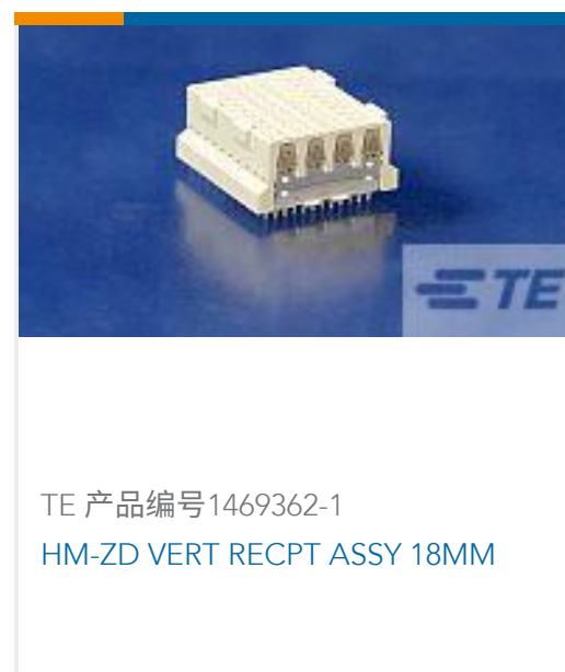
TE 产品编号1469362-1 HM-ZD VERT RECPT ASSY 18MM