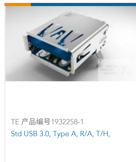
TE 产品编号1932258-1 Std USB 3.0, Type A, R/A, T/H,