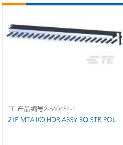
TE 产品编号2-640454-1 21P MTA100 HDR ASSY SQ STR POL