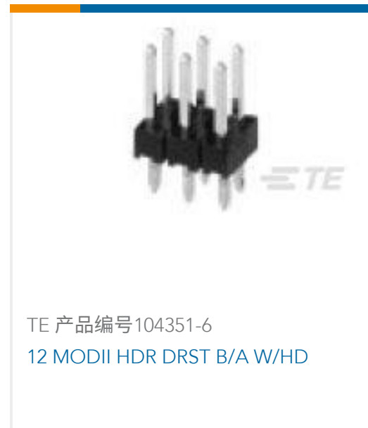
TE 产品编号104351-6 12 MODII HDR DRST B/A W/HD