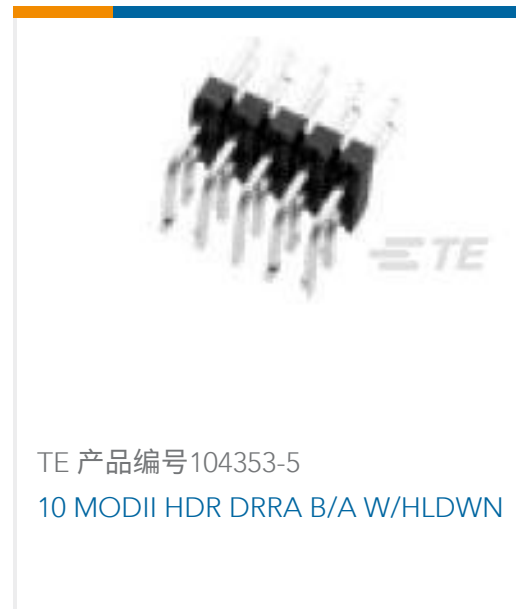
TE 产品编号104353-5 10 MODII HDR DRRR B/A W/HLDWN