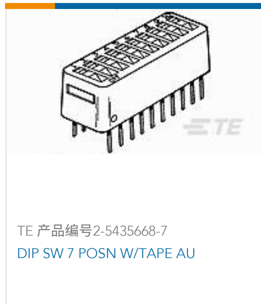
TE 产品编号2-5435668-7 DIP SW 7 POSN W/TAPE AU