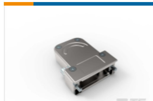
TE 产品编号1-2308341-3 FULL METAL HOODS SIZE 2-3 (RAW 180 DEG)