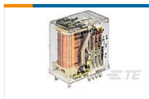
TE 产品编号1393766-9 R10-E1X2-V700=R10