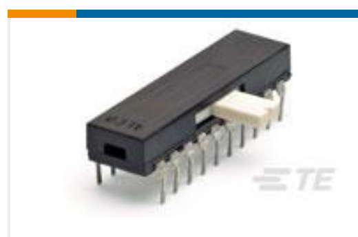
TE 产品编号1-1825010-8 ASE42L04=4PDT AUTOSLIDE