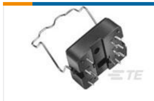
TE 产品编号1-1393824-0 V23154Z1028