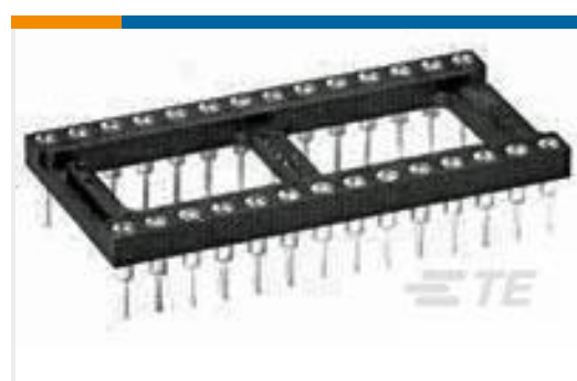
TE 产品编号1437539-5 808-AG11D-ES=SOCKET ASSY