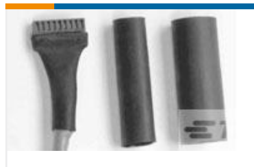
TE 产品编号E42160-000 DWP-125-KIT3