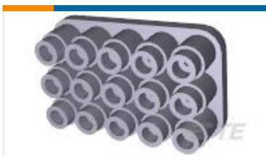
TE 产品编号794282-1 15P UMNL WIRE SEAL