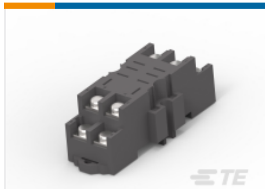
TE 产品编号2-1419106-7 27E895=SOCKET,K10,8,OC,POLY,NA