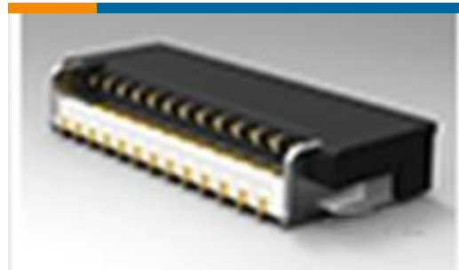
TE 产品编号2-2040832-1 EMBOSS TAPING 0.25FPC BF-L-1.3