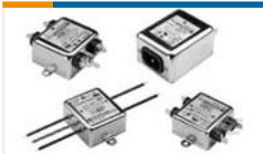
TE 产品编号1-6609028-3 10VK1=F7143 S0