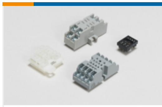
继电器附件、插座和卡箱(3)