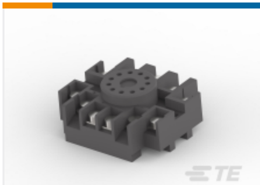
TE 产品编号2-1419106-4 27E892=SOCKET,KRPA,11,OCTAL,PO