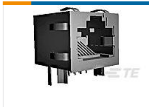
TE 产品编号1-1775365-4 MOD JACK, RJ45, SHIELD,50u" Au, L=2.05mm