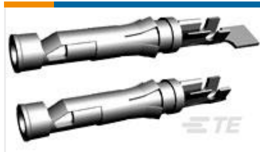
TE 产品编号1-66399-0 III+ SKT,24-20,TIN ,LP