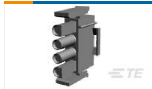
TE 产品编号1-480702-9 04P UMNL PLUG HSG BLK