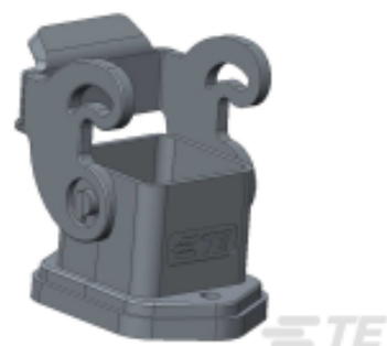
TE 产品编号 T1509031100-000 H3A-AG