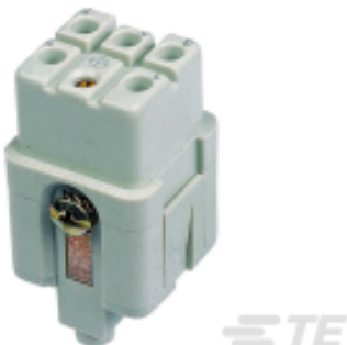
TE 产品编号 T2080052201-000 HQ-005-F