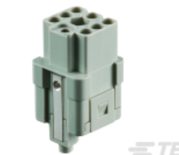
TE 产品编号 T2080072201-001 HQ-007-F,WITH SS SCREW,NO LOGO