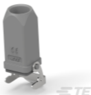
TE 产品编号 T1739032120-001 H3A-MTGVBS-M20