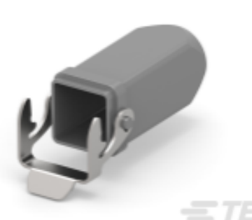
TE 产品编号 T1739032111-001 H3A-MTGVBS-PG11