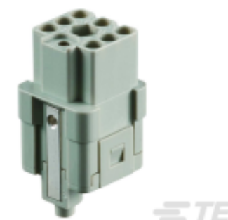
TE 产品编号 T2080072201-000 HQ-007-F