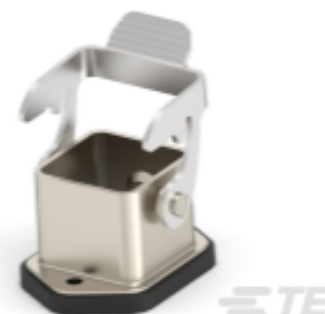
TE 产品编号 T1506032000-000 H3A-MAG-S-EMC