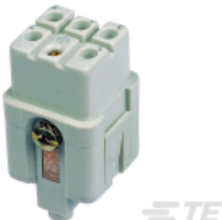
TE 产品编号 T2080052201-001 HQ-005-F