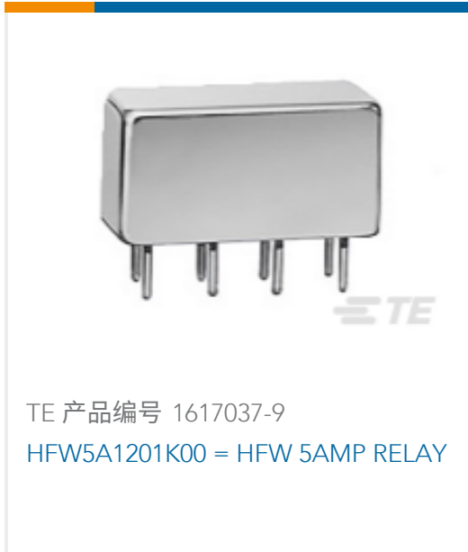
TE 产品编号 1617037-9 HFW5A1201K00 = HFW 5AMP RELAY