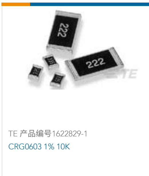
TE 产品编号1622829-1 CRG0603 1% 10K