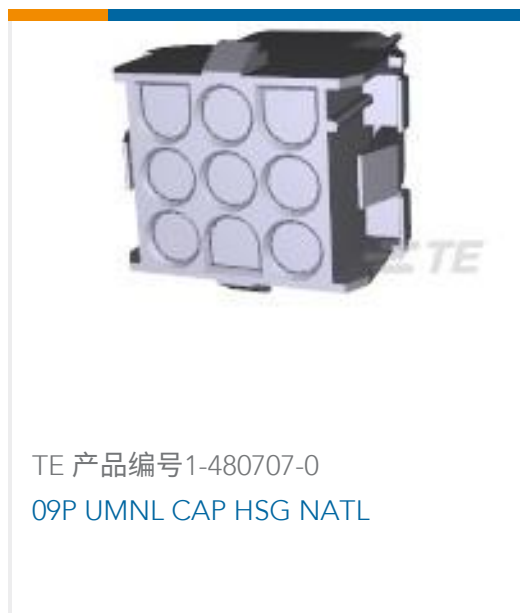
TE 产品编号1-480707-0 09P UMNL CAP HSG NATL