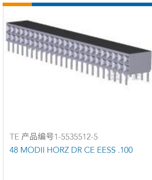
TE 产品编号1-5535512-5 48 MODII HORZ DR CE EESS .100