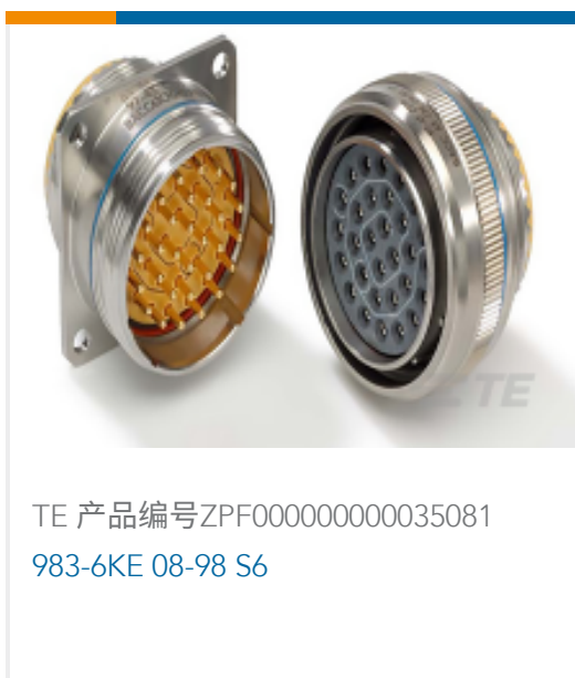
TE 产品编号ZPF000000000035081 983-6KE 08-98 S6