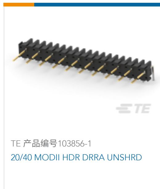
TE 产品编号103856-1 20/40 MODII HDR DRRA UNSHRD