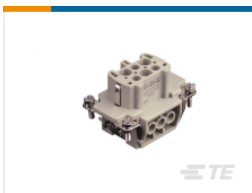
TE 产品编号 T2040062201-000 HE-006-F