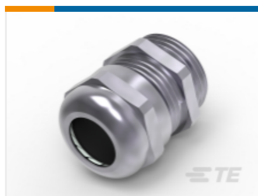
TE 产品编号 T3609200102-000 DLX-20-M