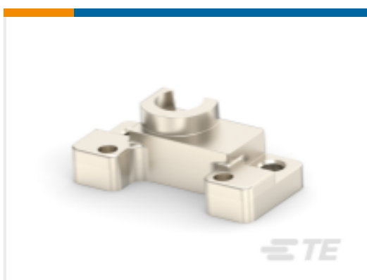
TE 产品编号 T3403121001-000 PANEL MOUNTED ADAPTER, NICKEL PLATED