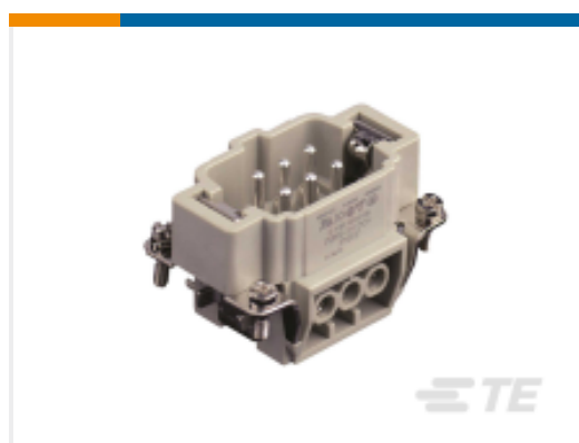
TE 产品编号 T2040062101-000 HE-006-M