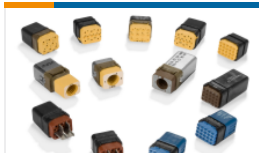
TE 产品编号ZPF00000000099685 DMC-M 99-01 SN