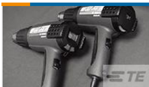
TE 产品编号 CJ2087-000 HL2010E-KIT-120V