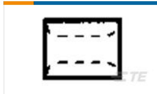
TE 产品编号323030 SPLICE,SOLIS PARA HR 22-16