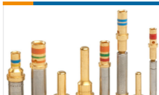
TE 产品编号38946-22L CONT SOC ASSY