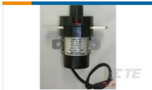
TE 产品编号2-1616980-5 K200A1C1=CONTACTOR 200 AMP SPST 28 VDC