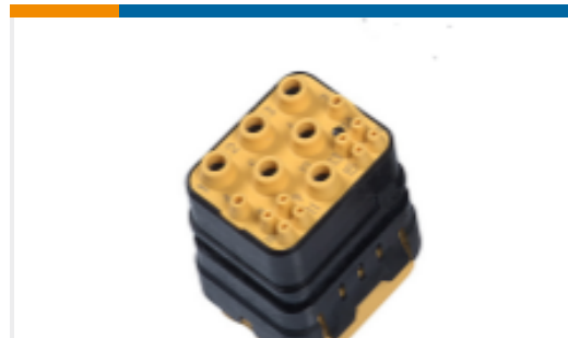
TE 产品编号2226454-1 PIN INSERT, 16-02 CABLE APPLIED