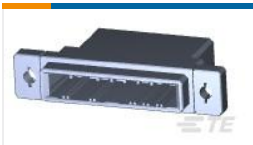
TE 产品编号1-178802-7 DYNAMIC3100S TAB HSG 8P PM X-K