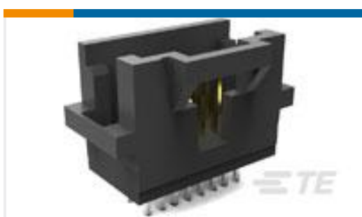
TE 产品编号1-104068-3 34 SYSTEM 50 HDR DRST SHRD