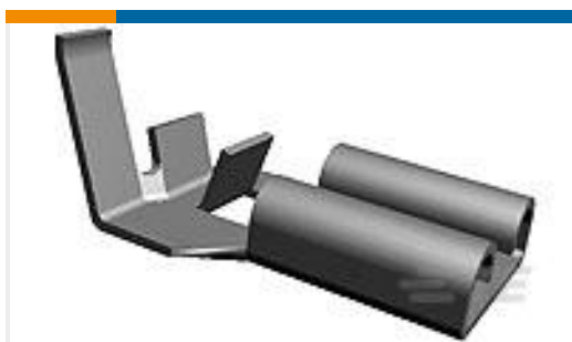
TE 产品编号1-1627102-4 UH2593ET/R2500