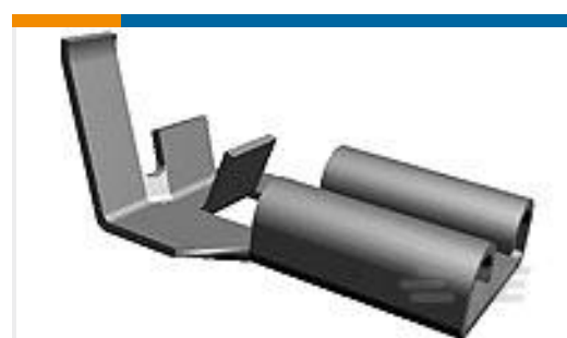
TE 产品编号1-1627101-2 H2592B/R1300