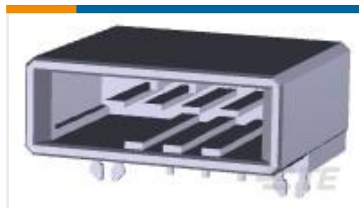
TE 产品编号1-178294-5 DYNAMIC D3100 HDR ASY 4P H K/X