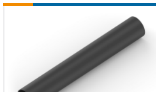
TE 产品编号NB13892001 TAT-125-1/2-0-STK