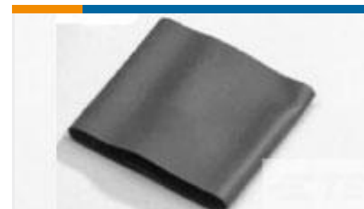
TE 产品编号046571J001 V2-18.0-0-FSP-SM