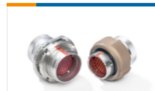
TE 产品编号ZPF000000000099828 901-21 RT 2-37-0 SN