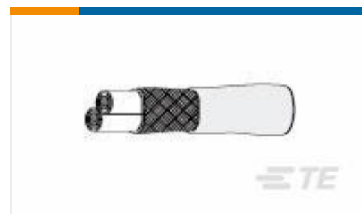
TE 产品编号306040-001 44AM1121-20-0/2-9