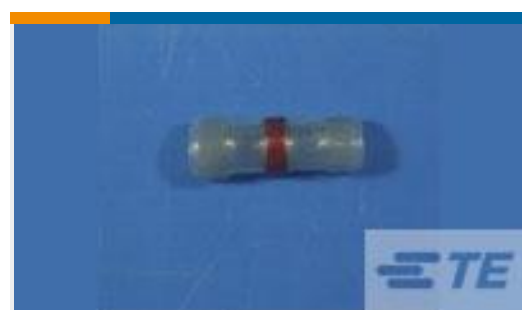
TE 产品编号359539-000 D-108-10CS948