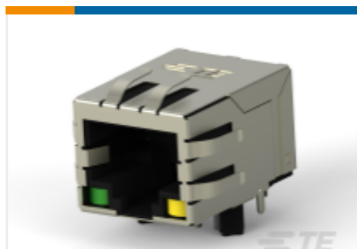
TE 产品编号2337992-4 RJ45 JACK MAG. POE 10/100 LED 1X1