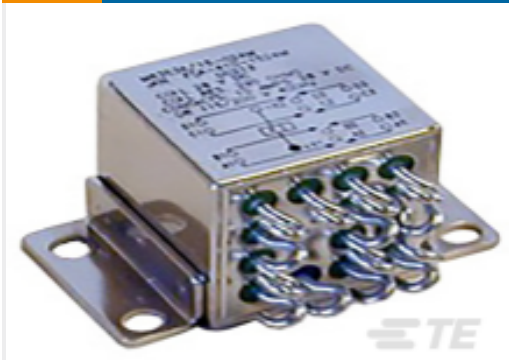
TE 产品编号 5-1617785-7 FCA-410-1521L=M83536/15-021L