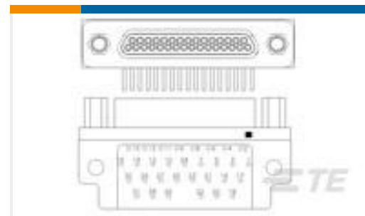
TE 产品编号1532254-4 M83513/10-E01NP = MCKS-N1-P-31PRT1