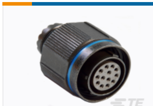
TE 产品编号YDTS26Z11-35JNV001 PLUG ASSY