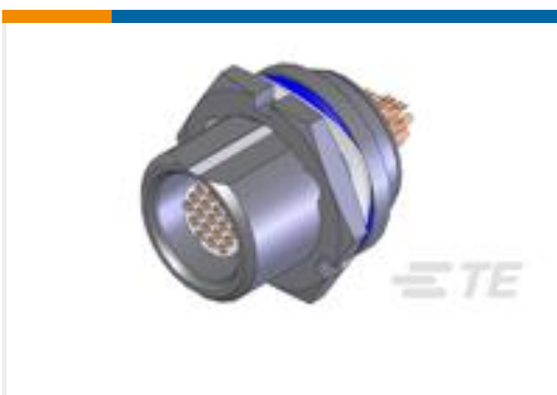
TE 产品编号2174196-1 Thread 19P Rece SP S-Cup Cont KIT/N