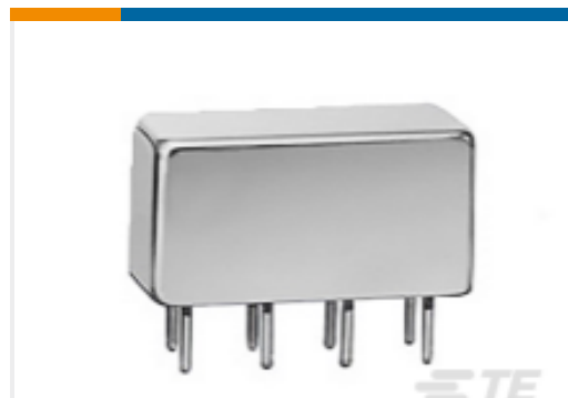
TE 产品编号1-1617030-7 HFW1201E00 = HFW 1/2 SIZE RELA