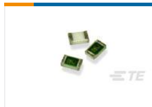
TE 产品编号1614889-1 CPF0805 11K8 0.1% 25PPM 1K RL