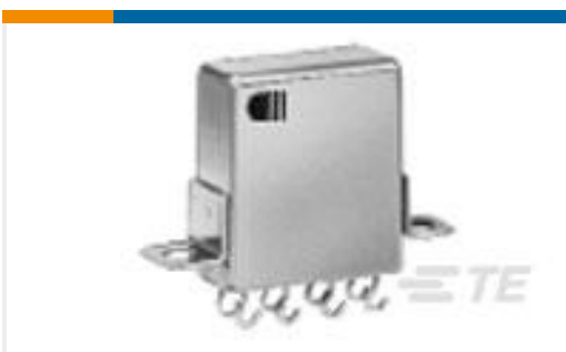
TE 产品编号1617022-2 FW5A1101G00 = 2020 FW5A RELAY